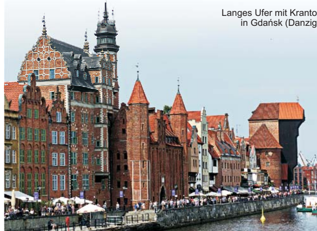
Langes Ufer mit Kranort in Gdańsk (Danzig)