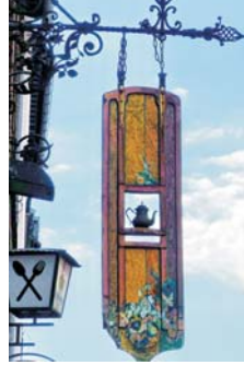
Wirtshaus in Torun