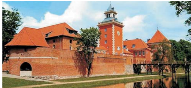
Hotel Krasicki in der Burg von Lidzbark Warminski

GEOPULS als Reiseveranstalter wurde 2004 von Dozenten des Geographischen Instituts in Tübingen gegründet und arbeitet seitdem mit ausgewählten Volkshochschulen zusammen. Begeisterte Geographen, die ein Land durch Ihre Arbeit während vieler Aufenthalte von allen Seiten kennen gelernt haben, führen Sie durch Kultur und Natur des jeweiligen Reisezieles. Bei einer Reise mit Geographen gibt es, neben den touristischen Höhepunkten, immer noch etwas mehr zu sehen und zu erleben. Wenig Bekanntes, tiefe Einblicke, das Erkennen von Zusammenhängen in Kultur- und Naturraum, Hintergründiges. Ausflüge in die Natur mit der einen oder anderen kleinen Wanderung gehören dazu, um auch die landschaftlichen Besonderheiten und deren Schönheit kennenzulernen und zu genießen. Die Teilnehmerzahl ist je nach Reise auf angenehme 12 bis max. 16 Personen beschränkt, was auch noch ein Reisen abseits massentouristischer Strukturen ermöglicht.