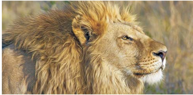
Löwe ( Panthera leo ) im Etosha-Park

Nach der Anmeldung wird mit der von GEOPULS zugesandten Buchungsbestätigung eine Anzahlung (15 % vom Reisepreis) fällig. Die Restzahlung erfolgt zwei Wochen vor Reisebeginn. Es gelten die Geschäftsbedingungen des Veranstalters: Geopuls GbR, Neckarhalde 62, 72108 Rottenburg. Bitte beachten Sie vor Reisebuchung unsere Allgemeinen Reisebedingungen sowie das Formblatt zur Unterrichtung des Reisenden bei einer Pauschalreise nach § 651a des BGB (EU-Richtlinie 2015/2302). Beides schicken wir vor Buchung gerne zu, oder kann auf/von der Webseite www.geopuls.de eingesehen und ausgedruckt werden.