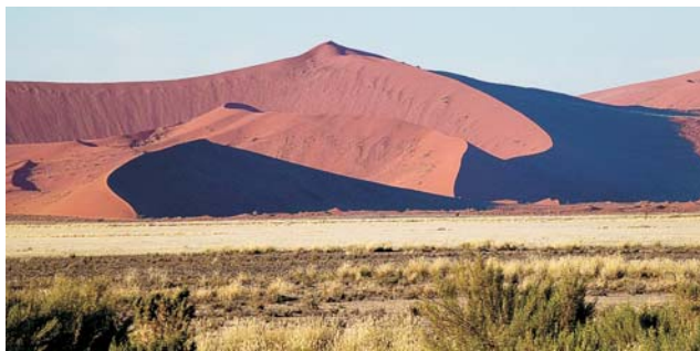
die Dünen im Sossusvlei zählen mit zu den höchsten der Welt

dieser Folder wurde CO 2 -neutral hergestellt