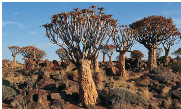
Köcherbäume (Aloe dichotoma)

GEOPULS als Reiseveranstalter wurde 2004 von Dozenten des Geographischen Instituts in Tübingen gegründet und arbeitet seitdem mit ausgewählten Volkshochschulen zusammen. Begeisterte Geographen, die ein Land durch Ihre Arbeit während vieler Aufenthalte von allen Seiten kennen gelernt haben, führen Sie durch Kultur und Natur des jeweiligen Reisezieles. Bei einer Reise mit Geographen gibt es, neben den touristischen Höhepunkten, immer noch etwas mehr zu sehen und zu erleben. Wenig Bekanntes, tiefe Einblicke, das Erkennen von Zusammenhängen in Kultur- und Naturraum, Hintergründiges. Ausflüge in die Natur mit der einen oder anderen kleinen Wanderung gehören dazu, um auch die landschaftlichen Besonderheiten und deren Schönheit kennenzulernen und zu genießen. Die Teilnehmerzahl ist je nach Reise auf angenehme 12 bis max. 16 Personen beschränkt, was auch noch ein Reisen abseits massentouristischer Strukturen ermöglicht.