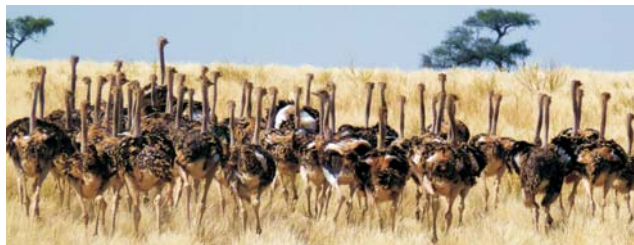
Afrikanische Strauße ( Struthio camelus )

Gepard ( Acinonyx jubatus ) - eine mögliche Begegnung im Etosha-Nationalpark